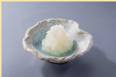
大根おろし 150円(税込165円)